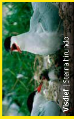
Visdief | Sterna hiruundo