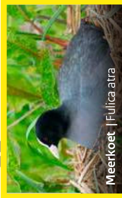
Meerkoet | Fulica atra