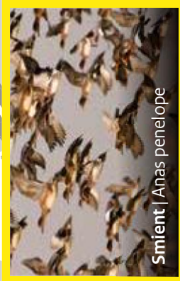
Smient | Anas penelope