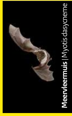
Meenvleermuis | Myotis dasycneme