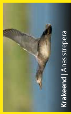
Krakeend | Anas strepera