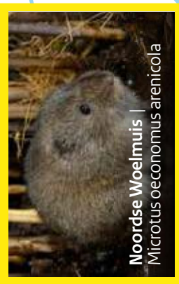
Noordse Woelmuis | Microtus oeconomus arenicola