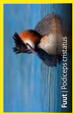
Fuut | Podiceps cristatus