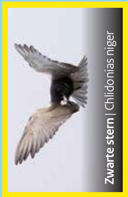
Zwarte stern | Chlidonias niger