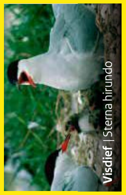
Visdief | Sterna hirundo