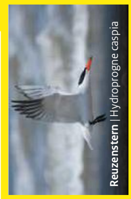
Reuzenster | Hydroprogne caspia