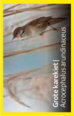
Grote karekiet | Acrocephalus arundinaceus