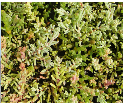
Schorrenkruid en Zeekraal